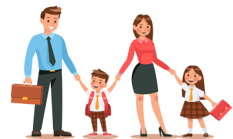
뚜벅뚜벅 녹색 등교·출근