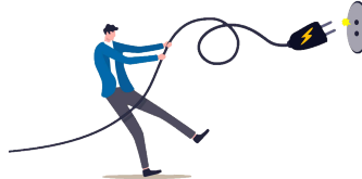
쓰지 않는 플러그, 잠시 안녕