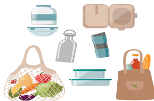
우리 같이 용기 내요