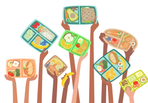
먹을 만큼 사고, 먹을 만큼 담고