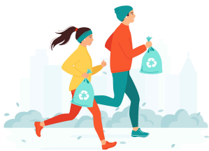
지구를 위해 줍고 달려요