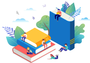
초록 독서, 초록 실천