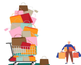
덜 소비하고, 더 많이 나누기