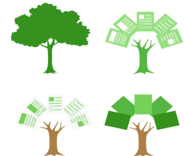
종이 없는 회의, 공책 있는 공부